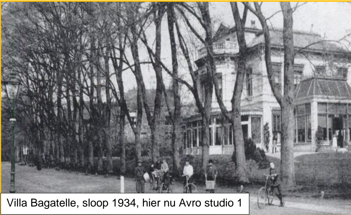
Villa Bagatelle, sloop 1934, hier nu Avro studio 1

In 1928 betrok de vereniging en het gezin van de directeur naar een villa (Sole Mio) aan de Oude Enghweg 4. In de doorgebroken kamer-en-suite was plaats voor een kamermuziekstudio, de keuken deed dienst als controlekamer en de buffetkamer werd tot omroep cel getransformeerd. Ook was er nog ruimte voor een spreekstudio. Voor opnamen van concerten en opera's maakte de AVRO in die tijd gebruik van de grote zaal van hotel-restaurant Hof van Holland. Snel werd de behoefte aan een beter geoutilleerd studiocomplex groter. In 1931 kocht de vereniging een terrein gelegen tussen de 's Gravelandseweg, Melkpad en Hoge Naarderweg voor f 55.000. Hierop stond in die tijd een grote, zij het verwaarloosde villa en een koetshuis. Besloten werd deze opstallen af te breken. Besloten werd deze opstallen af te breken. Drie jaar later werd ook nog het terrein aan de overkant van het Melkpad gekocht.