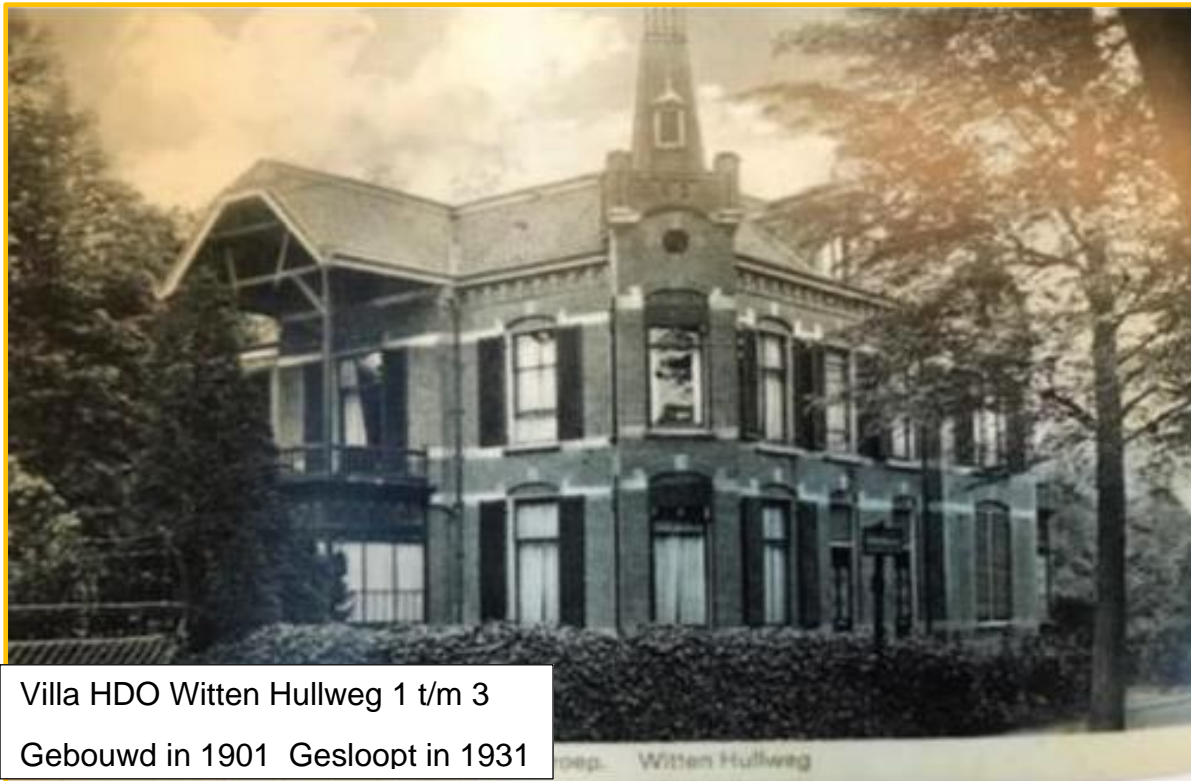
Villa HDO Witten Hullweg 1 t/m 3

Vanaf 1923 begint ook de door de Nederlandse Seintoestellen Fabriek (NSF) in Hilversum opgerichte Hilversumsche Draadloze Omroep (HDO) uit te zenden. In het toen verzuilde Nederland werd in 1924 door de protestanten de NCRV opgericht gevolgd door de KRO en de VARA in 1925 en medio 1926 de VPRO.